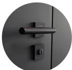
Türgriff nach hinten geöffnet

Passend für sämtliche handelsüblichen Türgriffmodelle