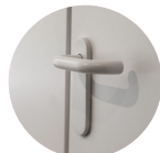
Türgriff nach hinten geschlossen

Mit dem Türdrücker G2 stellen Ihre Türklinken kein gesundheitliches Risiko mehr dar, denn die Verbreitung von Viren und Bakterien über Handflächen gehört damit der Vergangenheit an. Passend für sämtliche handelsüblichen Türgriffmodelle – egal, ob der Griff rund oder eckig geformt ist – lässt sich der Türdrücker G2 ohne großen Aufwand auf den bestehenden Türgriff montieren und erlaubt eine komfortable, sichere Öffnung der Tür per Handgelenk oder Ellenbogen. Das Modell ist paarweise zur Links- und Rechtsmontage erhältlich.